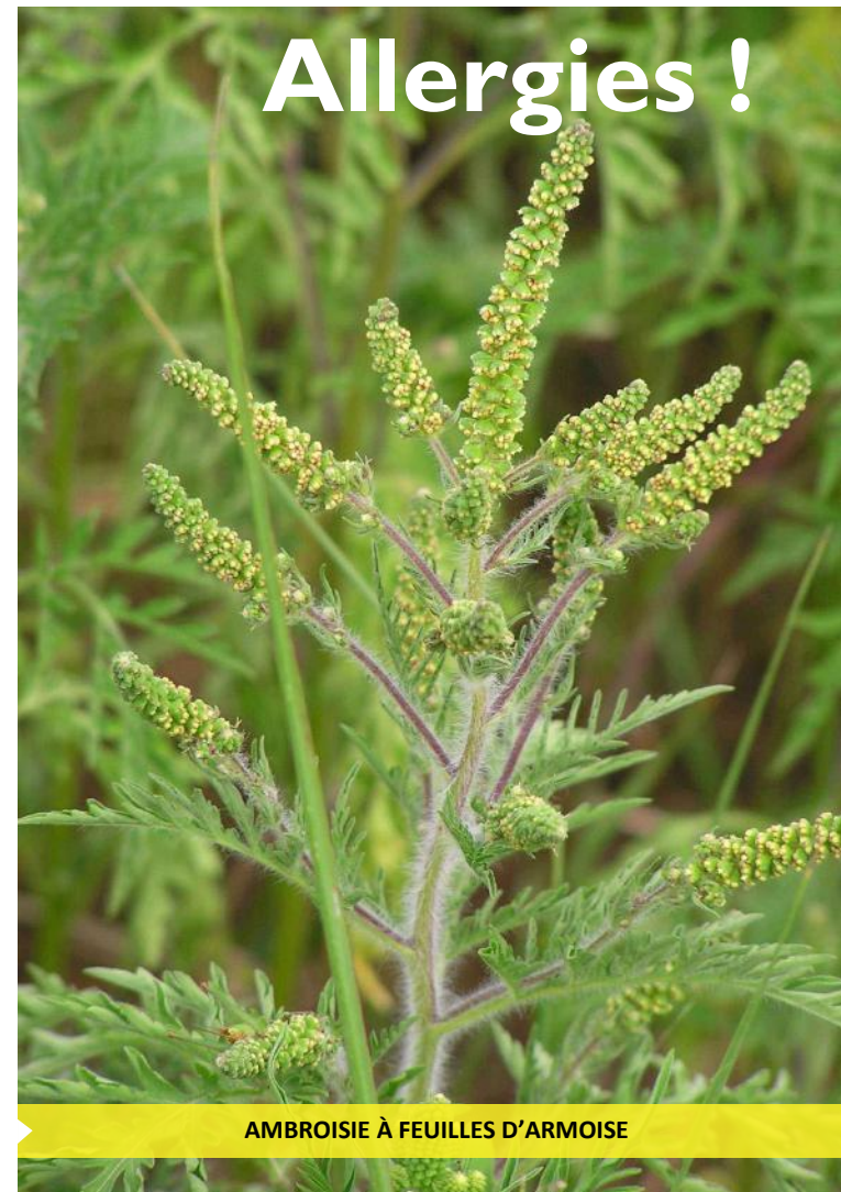
AMBROISIE À FEUILLES D'ARMOISE